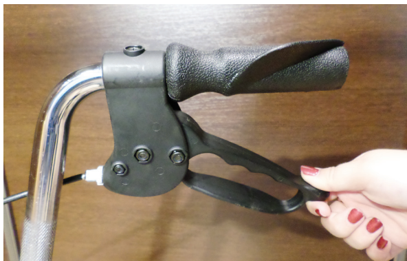
Pav. Nr. 3 / Att. Nr. 3 / Pilt nr 3 / Pic. No 3 / Рис. Но. 3 / Nr. 3 / Obr. 3