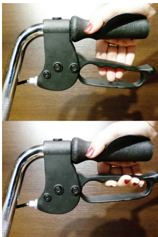
Pav. Nr. 2 / Att. Nr. 2 / Pilt nr 2 / Рис. No 2 / Рис. No. 2 / Nr. 2 / Obr. 2