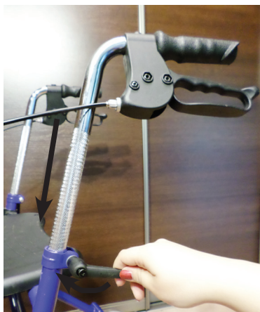
Pav. Nr. 1 / Att. Nr. 1 / Pilt nr 1 / Pic. No 1 / Рис. Ho. 1 / Nr. 1 / Obr.1

• Įstatykite rankeną į pagrindinį rėmą, nustatykite rankeną patogiam aukštyje ir priveržkite rankenėle sukdamą ją pagal laikrodžio rodyklę. Svarbu, kad abi rankenos būtų nustatytos tame pačiame aukštyje. Rankenų fiksavimo rankenėlės padėtis taip pat gali būti pakeista nuspaudus mygtuką, esantį centre ir pasukus rankenėlę pagal laikrodžio rodyklę.